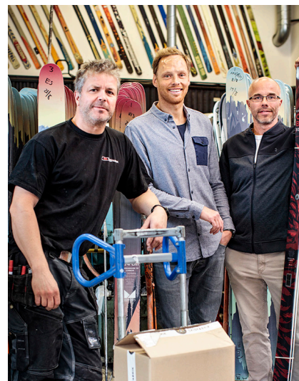
Åre Skidfabrik AB tillverkar skidor för främst alpin åkning i Såå, Åre kommun.